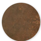
Terre de mars Un effet rouillé oxydé.