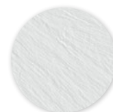
Ardoise blanche Un blanc structuré soyeux.