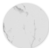
Marbre blanc Reprend les veinages du véritable marbre.