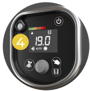
Écran LCD rétro éclairé à portée de main